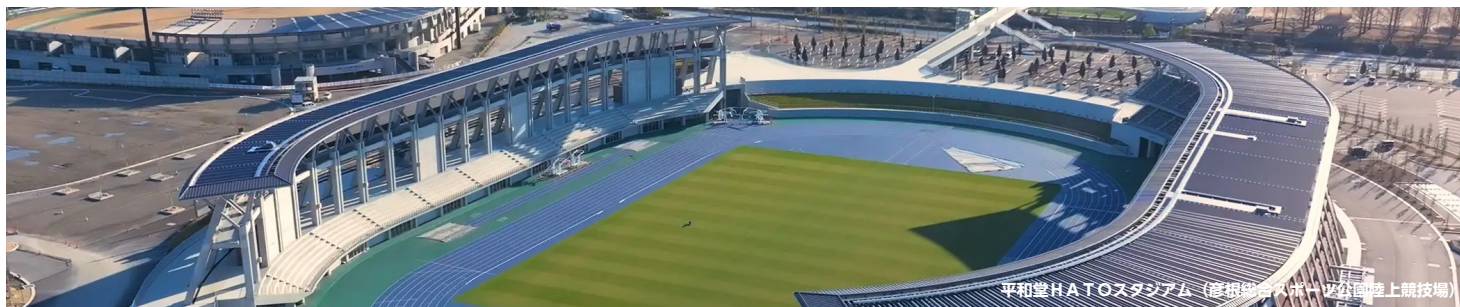
平和堂HATOスタジアム（彦根総合スポーツ公園陸上競技場）