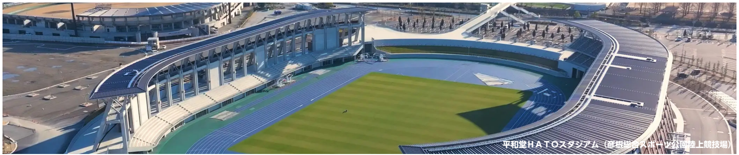
平和堂HATOスタジアム（彦根総合スポーツ公園陸上競技場）