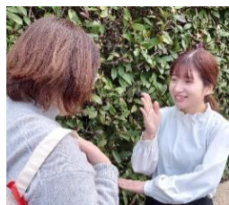
手話でコミュニケーション