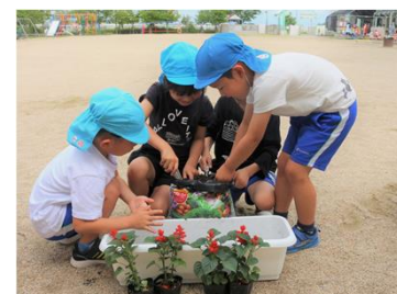
花育て(幼稚園、自治会等)