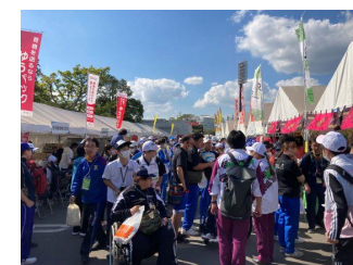
滋賀の特産品や郷土料理をPR