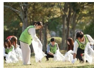
大会を支えるボランティア