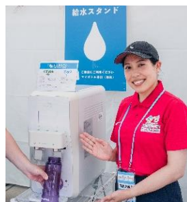
各会場に給水機を設置