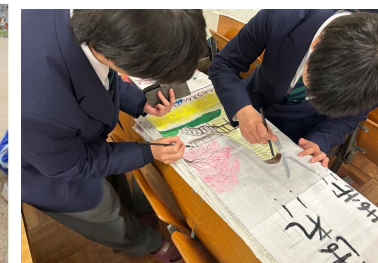
応援手作りのぼり旗の作成