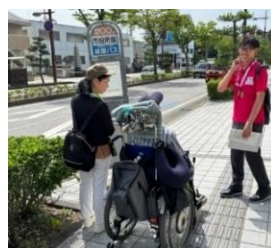
会場周辺バリアフリー調査