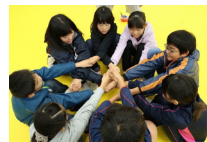
未来につながる 滋賀レイキッズ