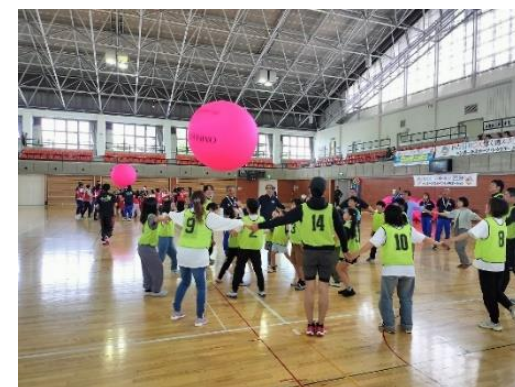
デモンストレーションスポーツ