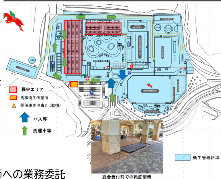
総合受付前の靴底消毒