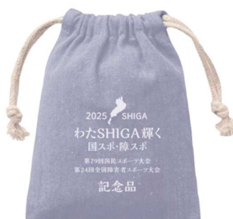
巾着サイズ：130 mm×100 mm