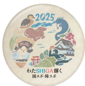
マグネット：直径 60 mm 重さ：60g～70g 程度