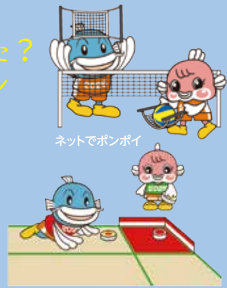
ネットでポンポイ

みんなが参加できるスポーツがある? 今回の大会で実施される89種類の競技のうち26種類は、スポーツ経験のある人もない人も、みんなが参加できるデモンストレーションです。「ひこねスーパーカロム」「ネットでポンポイ」「スポーツチャンバラ」など面白そうなスポーツが盛りだくさん! みんなもぜひ参加してみよう!