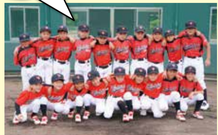
日野ファイターズのみなさん

特大ホームランや、ファインプレーを間近で見られたらいいなと思います。どの選手も優勝目指して頑張ってください!