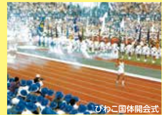
びわこ国体開会式

第79回国民スポーツ大会・第24回全国障害者スポーツ大会(愛称:わたSHIGA輝く国スポ・障スポ)が、2025年に滋賀県で開催されます。滋賀県での開催は、1981年の「びわこ国体・びわこ大会」以来、44年ぶり2度目です!