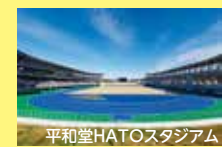
平和堂HATOスタジアム

びわこ国体のメイン会場は、皇子山陸上競技場(大津市)。わたSHIGA輝く国スポ・障スポのメイン会場は平和堂HATO(はと)スタジアム(彦根市)です。開会式・閉会式・陸上競技が行われます。