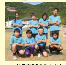
八日市FCのみなさん