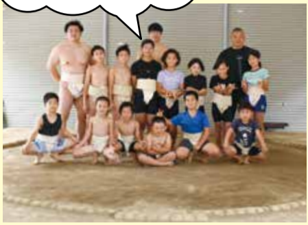
長浜相撲クラブのみなさん

国スポの相撲では、各代表のチーム(子どもと大人)の団体戦があると、面白そう!楽しみにしています。