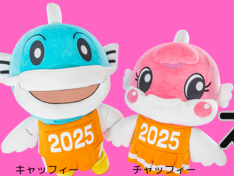
キャッピー チャッピー