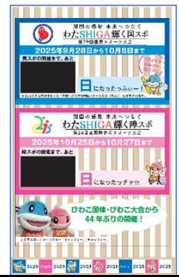
カウントダウンボード

県立スポーツ施設や競技団体に横断幕を提供し掲出を依頼するほか、滋賀県大津合同庁舎の南側壁面 (R5. 9. 1～10. 31、R6. 1. 4～2. 29)、北側壁面 (R5. 10. 31～R6. 1. 4、R6. 3. 1～8. 1[予定]) に会期入り特大横断幕を掲出した。