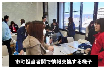
市町担当者間で情報交換する様子

b 県主催のイベントにおける市町PRブースの設置や市町が実施するイベントへの県の参画など相互協力によるイベント啓発を実施した。