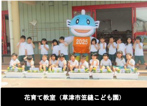
花育て教室（草津市笠縫こども園）