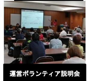
運営ボランティア説明会

【応募状況（延べ人数）：国スポ1,266人、障スポ563人（令和6年1月末現在）】