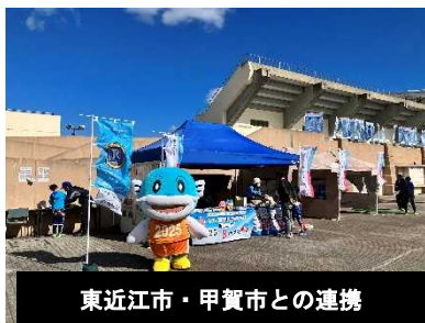
東近江市・甲賀市との連携

b 県主催のイベントにおける市町PRブースの設置や市町が実施するイベントへの県の参画など相互協力によるイベント啓発を実施した。