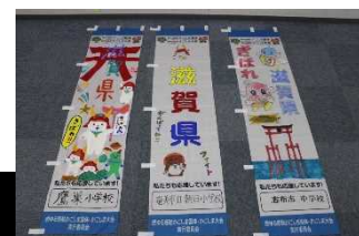
手づくりのぼり旗 (鹿児島県)

両大会に参加する各都道府県および政令指定都市選手団を歓迎・応援するため、児童生徒達が制作したのぼり旗を開・閉会式会場等に設置する予定。令和6年度は制作を依頼し、提出いただく予定。