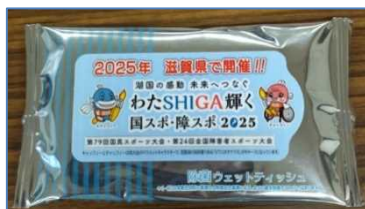
ウェットティッシュ

クリアファイル、ウェットティッシュ、絆創膏、ポケットティッシュ、ボールペン、蛍光ペン、シール等をイベントでの啓発活動に活用した。