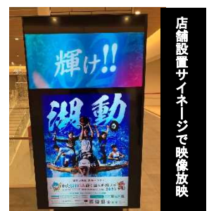
店舗設置サイネージで映像放映