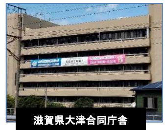
滋賀県大津合同庁舎