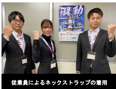
従業員によるネクストラップの着用

企業・団体の協力により、営業店舗等での広報物の掲示、従業員のネクストラップの着用、営業車両へのマグネットシートの貼付、営業店舗等のデジタルサイネージでの映像放映等を実施した。