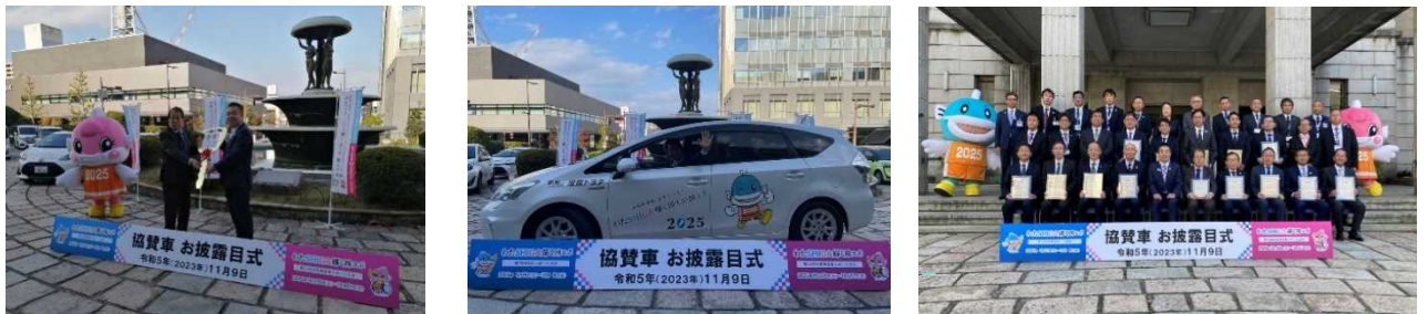
R5.11.9 協賛車両 お披露目

企業協賛についても、寄附と併せて会合の場の活用や企業訪問による依頼活動を行った。令和5年11月9日には、県庁にて県内15社の自動車販売会社様から協賛いただいた「わたSHIGA 輝く国スポ・障スポ」仕様のラッピング車両20台をお披露目、感謝状贈呈を行った。