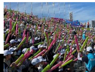
都道府県応援団（鹿児島県）

開・閉会式において、各都道府県選手団に対して観覧席から応援する「都道府県応援団」の活動について検討を進める。