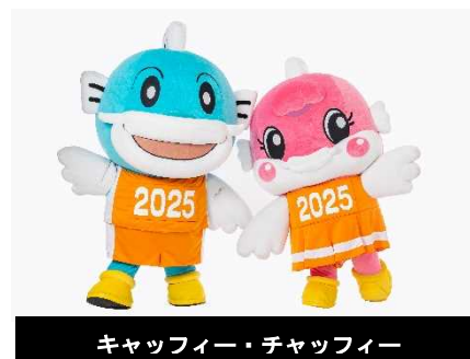
キャプフィー・チャップフィー

着ぐるみをイベント啓発等で使用しPRに活用するとともに、地域のスポーツ大会やイベント等で幅広く活用いただけるよう貸し出しを行い、両大会の広報・啓発を実施する。