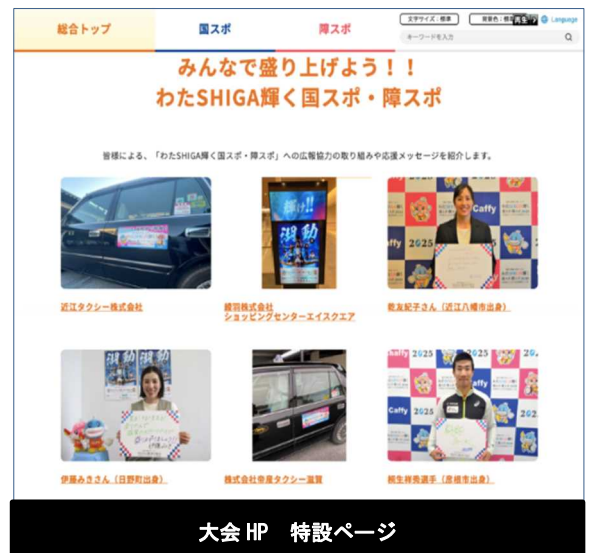
大会 HP 特設ページ