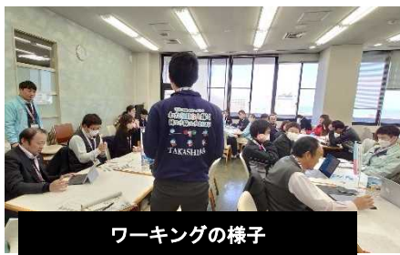
ワーキングの様子