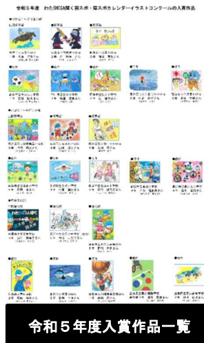
令和5年度入賞作品一覧

また、令和5年度コンクールの入賞作品を使用したカレンダー(令和6年4月始まり)を作製し、県立施設や市町立施設等に配布予定(令和5年度入賞作品の展示を令和6年3月に予定)。