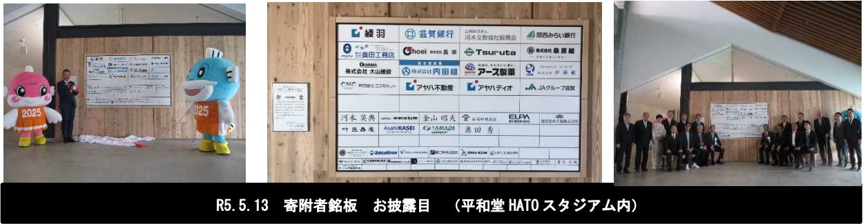
R5.5.13 寄附者銘板 お披露目 (平和堂 HATO スタジアム内)