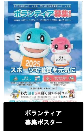
ボランティア募集ポスター