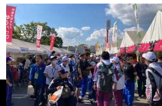
おもてなし広場 (鹿児島)

おもてなし広場基本計画に基づき、広場レイアウト等を検討するとともに、関係機関や協賛企業等への出店意向調査や、出店手続き等を定める売店等設置運営要項を作成するなど、おもてなし広場の設置へ向けた準備を進める。