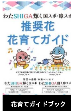
花育てガイドブック