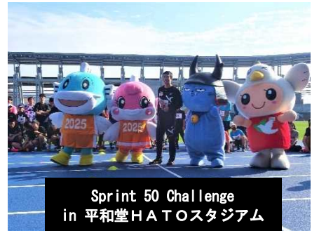
Sprint 50 Challenge in 平和堂HATOスタジアム