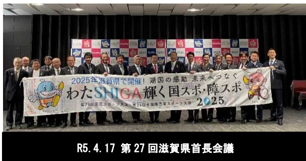
R5.4.17 第27回滋賀県首長会議

イ 大会HPに「みんなで盛り上げよう!! わたSHIGA輝く国スポ・障スポ」ページを立ち上げ、企業・団体による大会広報への協力の取組や滋賀ゆかりのアスリートからのメッセージの掲載を開始した。