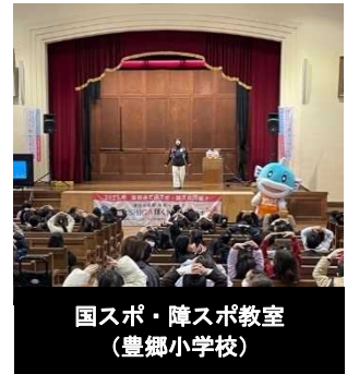
国スポ・障スポ教室 (豊郷小学校)

昨年度に引き続き、イメージソングの作詞・作曲、歌唱者のyokkoさんを講師としてわたSHIGA輝く国スポ・障スポのPR、講話やイメージソング歌唱、手話歌体験等を行う「国スポ・障スポ教室」を県内11の小・中学校で実施した。