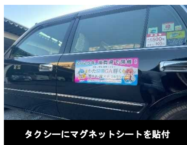
タクシーにマグネットシートを貼付