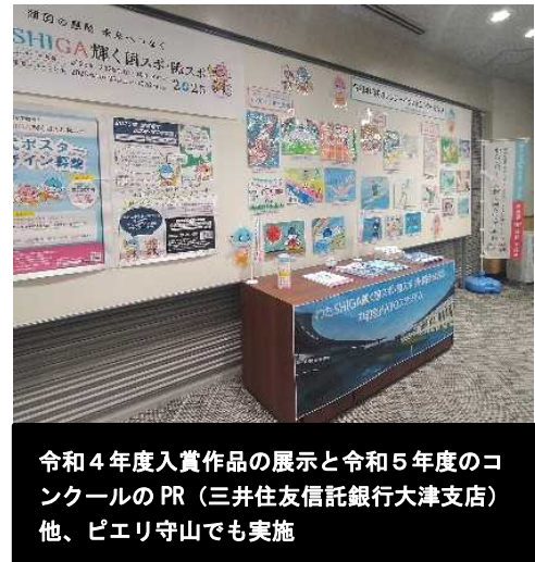
令和4年度入賞作品の展示と令和5年度のコンクールのPR(三井住友信託銀行大津支店)他、ピエリ守山でも実施