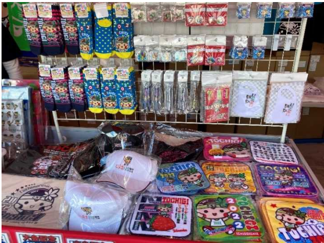
マスコットキャラクターの商品化権