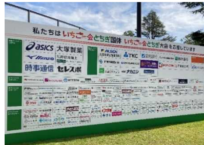
屋外PR看板への企業ロゴの掲出