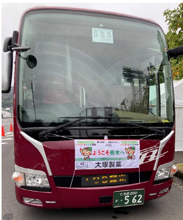
バスフロントマスクへの企業ロゴの掲出