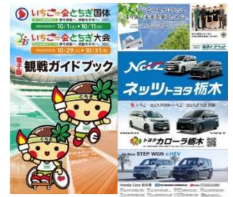
観戦ガイドブックへの広告掲載