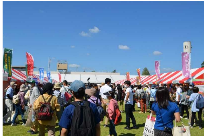
開・閉会式会場におけるブース出展権