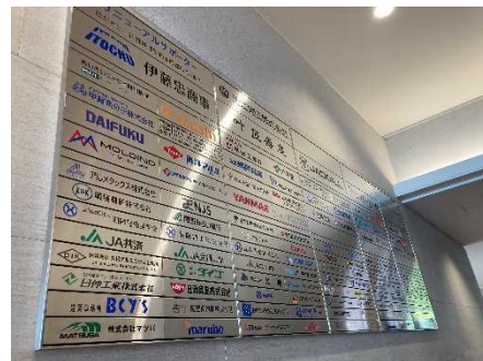
銘板イメージ (参考:琵琶湖博物館)