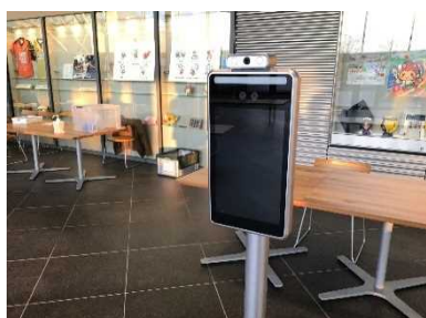
<検温装置(サーモグラフィ)>