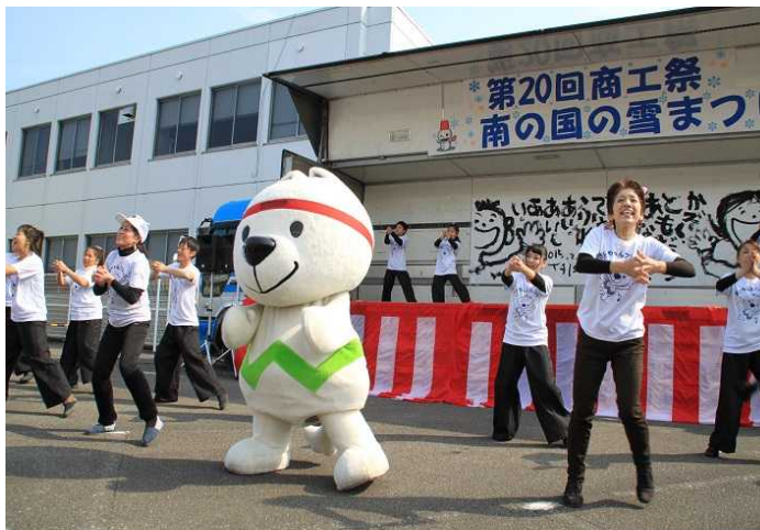
きいちゃん広報ファミリー (和歌山県)