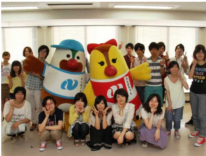
長崎がんばらんば隊 (長崎県)