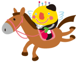
茨城県「いばラッキー」