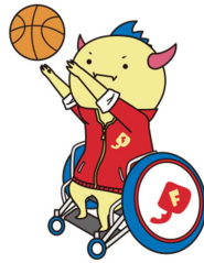
福井県「はぴりゅう」